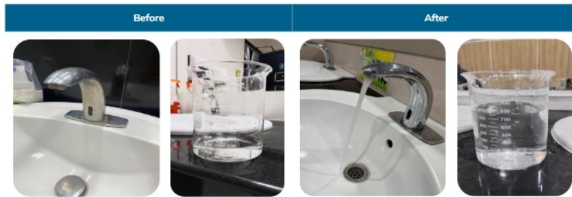
โครงการประสิทธิภาพการใช้น้ำ